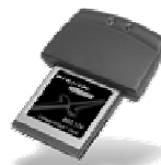
WLAN-Karte (ca. CHF 150.-)