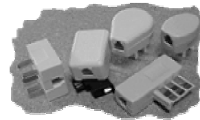
Kabel, allenfalls Adapter?