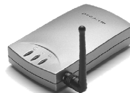
Basisstation (vom Betreiber)