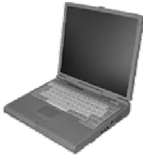
Laptop mit integriertem Modem