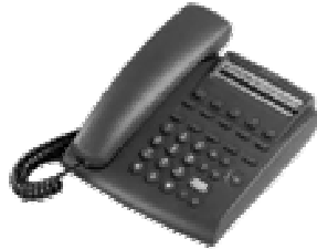
Hoteltelefon mit separater RJ45-Buchse für Modemkabel